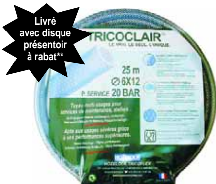
**jusqu'au diamètre 13

Embout cannelés, à olive ou à gorge (type Express). Montage avec colliers à bande, à tourillons, à oreilles (éviter les colliers à une oreille), ou coiffes adaptées. Le sertissage avec des jupes non blessantes est possible (nous consulter dans ce cas). Bien veiller avant montage à ce que l'embout ne soit pas blessant pour