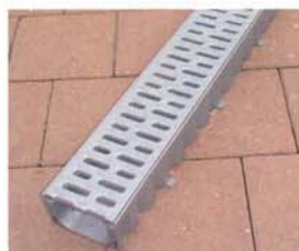
look métallique corps et grille