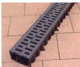
noir corps et grille

Choisissez la couleur et la conception de grille convenant le mieux à votre revêtement et votre environnement: