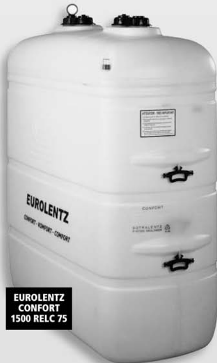
EUROLENTZ CONFORT 1500 RELC 75

Conforme à la nouvelle réglementation et à la Norme