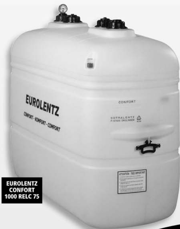
EUROLENTZ CONFORT 1000 RELC 75