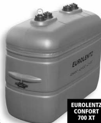
EUROLENTZ CONFORT 700 XT

Conforme à la nouvelle réglementation et à la Norme