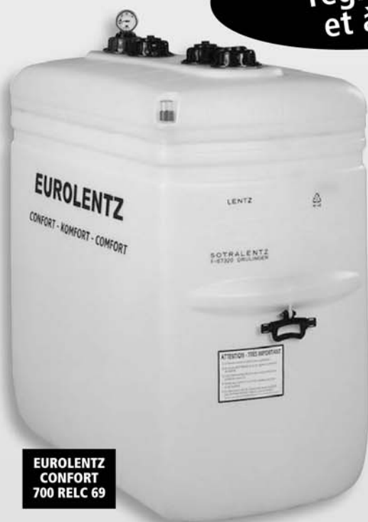
EUROLENTZ CONFORT 700 RELC 69

Conforme à la nouvelle réglementation et à la Norme