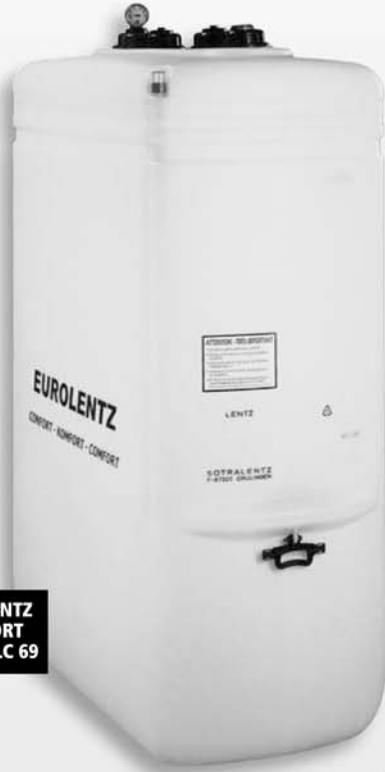
EUROLENTZ CONFORT 1000 RELC 69