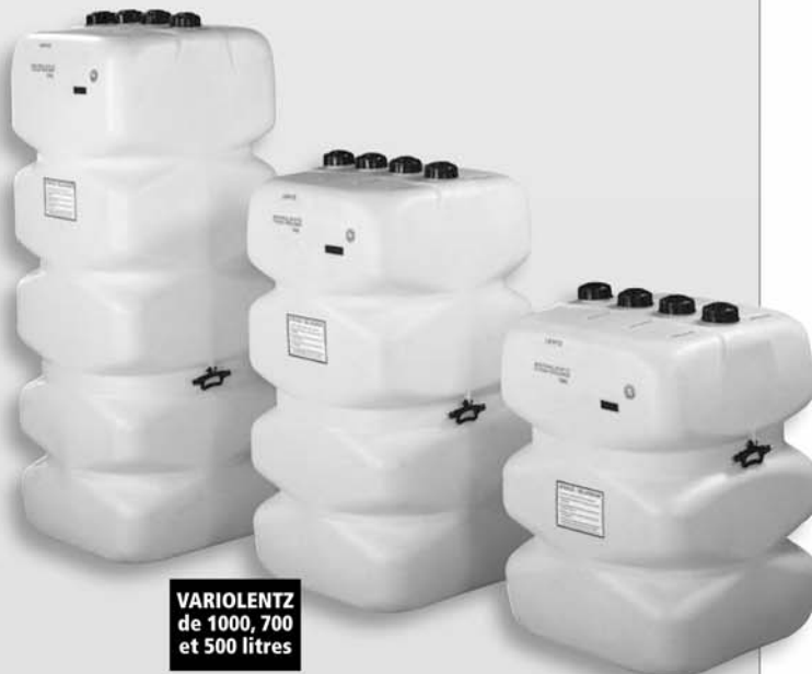
VARIOLENTZ de 1000, 700 et 500 litres