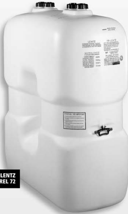
EUROLENTZ 1500 REL 72